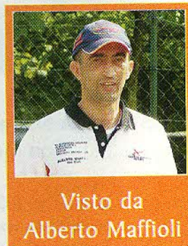
Visto da Alberto Maffioli

Q uesta volta parleremo di un accessorio poco conosciuto (non se ne parla mai), ma importante... tanto che tutti gli arcieri, ma proprio tutti, non possono farne a meno: la faretra!