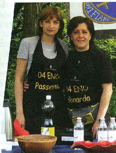
L'accoglienza al primo ristoro.