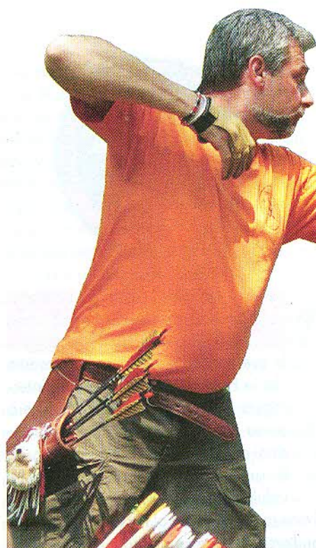
Al tiro con il ricurvo.