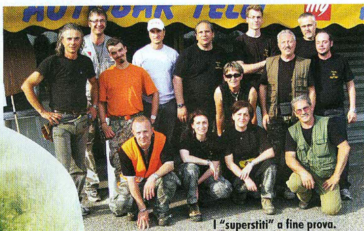
I "superstiti" a fine prova.