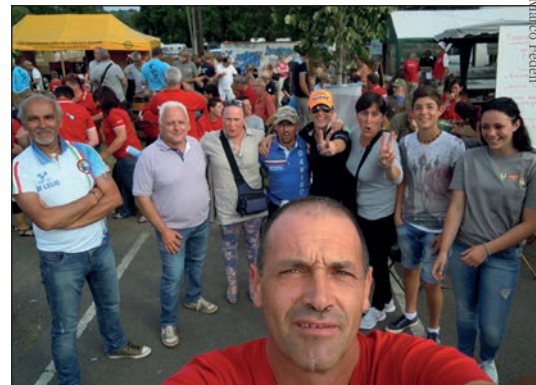
Villaggio dell'arciere: a fine gara c'è anche il tempo per qualche foto, in questa alcuni dei nostri atleti.

avuto proposte indecenti di scambio... a parte la friendly competition, a parte che siamo tutti amici ed europei... ma le nostre super tecniche in cambio di uno straccetto misto nylon? In pratica noi italiani eravamo soppesati ed osservati, ma mica per la bravura arcieristica o per la prestanza fisica, solo per individuare meglio la taglia della nostra maglietta per poi proporci lo scambio alla pre-