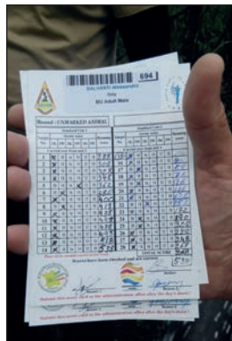
Un esempio di score Ifaa, abbiamo preso un arciere Fiar a caso...

era predisposto un servizio di pullman direi notevolmente efficiente e organizzato, quindi era sufficiente ricordarsi il colore del proprio percorso, presentarsi al villaggio in orario, non prendere un caffè, seguire gli annunci che segnalavano i colori in partenza, imbarcarsi sul mezzo col colore giusto e rilassarsi. Il dopo gara seguiva lo stesso copione, ci si raccoglieva al punto di arrivo e in pochi minuti cominciavano ad arrivare i mezzi per il ritorno. Il ritorno ci vedeva stanchi, assetati e muti, però al reparto bar già sapevano, solo al guardarti, che volevi una birra, non riuscivi a parlare ma loro ti capivano al volo e assieme alla birra sempre, prima e dopo, una frase di cortesia... Non chiedetemi in quale