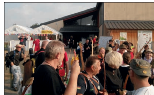
Al villaggio dell'arciere, prima della partenza.