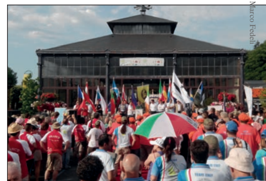
Arcieri e bandiere hanno invaso le strade di Confolens, durante l'inaugurazione.