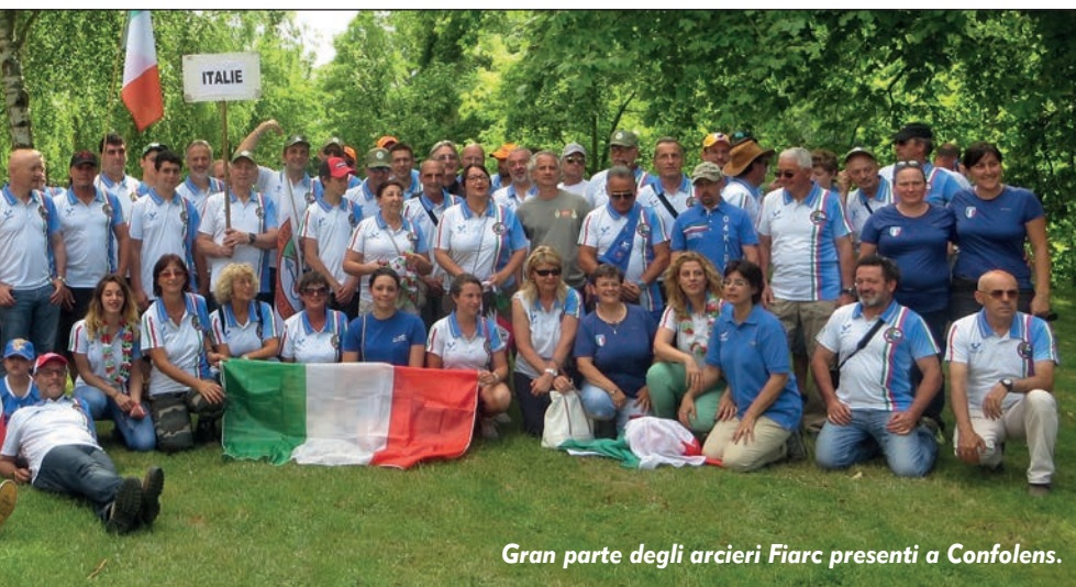
Gran parte degli arcieri Fiarç presenti a Confolens.