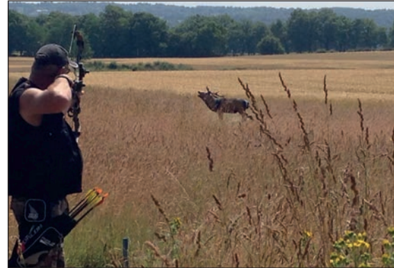
Come si vede in queste immagini, il terreno che ospitava i campi di gara offriva una notevole varietà di paesaggi e di tiri.

avuto proposte indecenti di scambio... a parte la friendly competition, a parte che siamo tutti amici ed europei... ma le nostre super tecniche in cambio di uno straccetto misto nylon? In pratica noi italiani eravamo soppesati ed osservati, ma mica per la bravura arcieristica o per la prestanza fisica, solo per individuare meglio la taglia della nostra maglietta per poi proporci lo scambio alla pre-