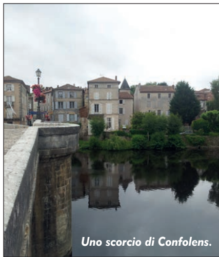
Uno scorcio di Confolens.

S iamo ormai tornati tutti o quasi dall'Ebhc 2014, dico quasi perché nel momento in cui scrivo mi risultano ancora degli arcieri in vacanza in giro a gozzovigliare in territorio francese; chi per festeggiare una medaglia, chi solo per il gusto di godersi un po' di vacanza. Personalmente sono rientrato quasi subito in Italia, partendo il sabato mattina presto, dovendo arrivare a Torino almeno per il sabato sera. Memore delle interruzioni trovate all'andata, delle numerose e sfinenti deviazioni, ho optato per una sveglia ancora sotto i postumi dei festeggiamenti della cerimonia di chiusura, pur di arrivare e dormire almeno otto ore prima della solita gara domenicale. Il mio arrivo ad