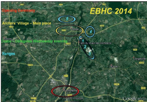
Questa immagine offre un'idea di come erano dislocati campi e villaggio dell'arciere.

solo la parte bevande e cibarie ha avuto un minimo di coda, solamente al primo impatto di arcieri affamati, già al secondo la linea Maginot era stata ben rinforzata. Particolare importante, quello che di solito porta aggregazione, è stato il prevedere durante tutta la giornata, dal primo all'ultimo giorno, uno spazio centrale di animazione, chiaramente a pieno regime dal primo pomeriggio, all'ar-