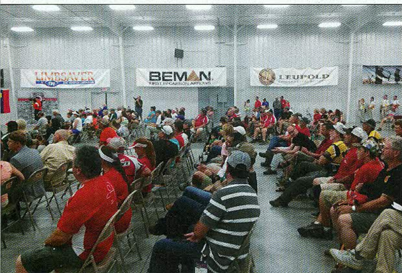
I World Field Archery Championships si sono svolti presso l'impianto dove ha sede la Federazione americana. Quella Yankton in cui si trova uno dei sei centri di formazione arcieristica finanziati dalla fondazione Easton.