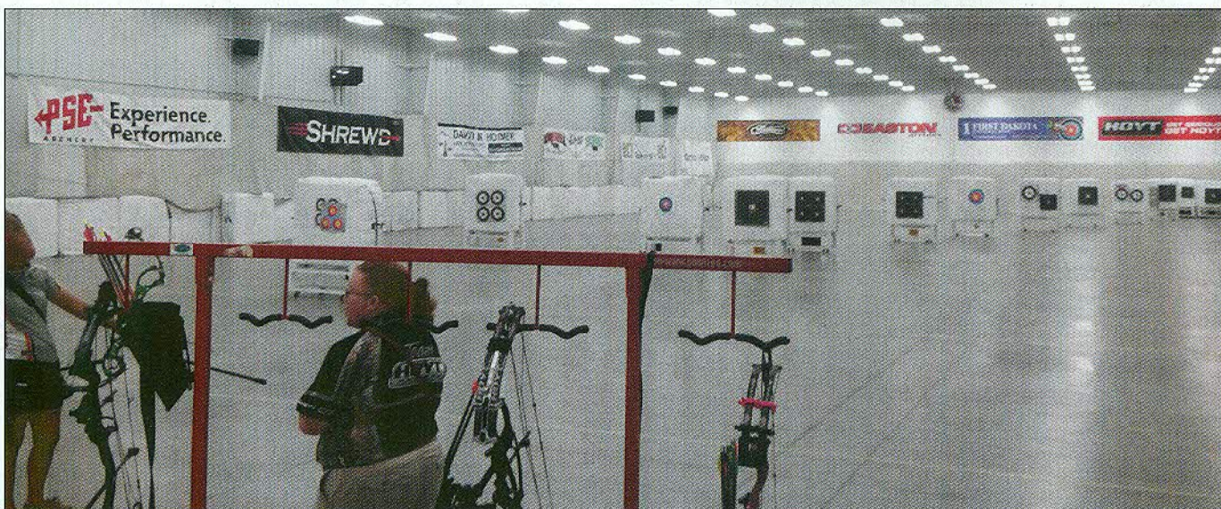
Appena arrivati presso la sede dell'evento, una bellissima sorpresa: nell'immenso padiglione inaugurato due anni fa, nel quale si può tirare Indoor fino a 70 metri, si stavano allenando tutti i professionisti americani più famosi, che il giorno successivo avrebbero partecipato ai Campionati nazionali.