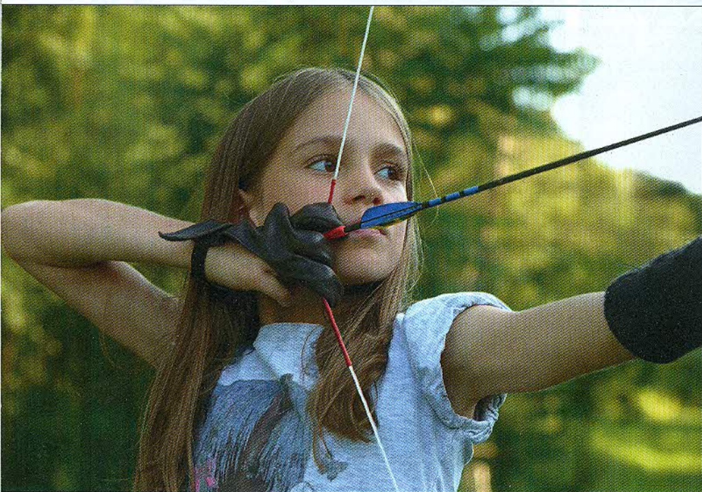
Secondo scatto classificato, autore Stefano Mazza.

Per l'edizione 2014 il concorso fotografico indetto dalla Fiarc prevedeva come soggetti i piccoli arcieri. Ecco le immagini vincitrici.