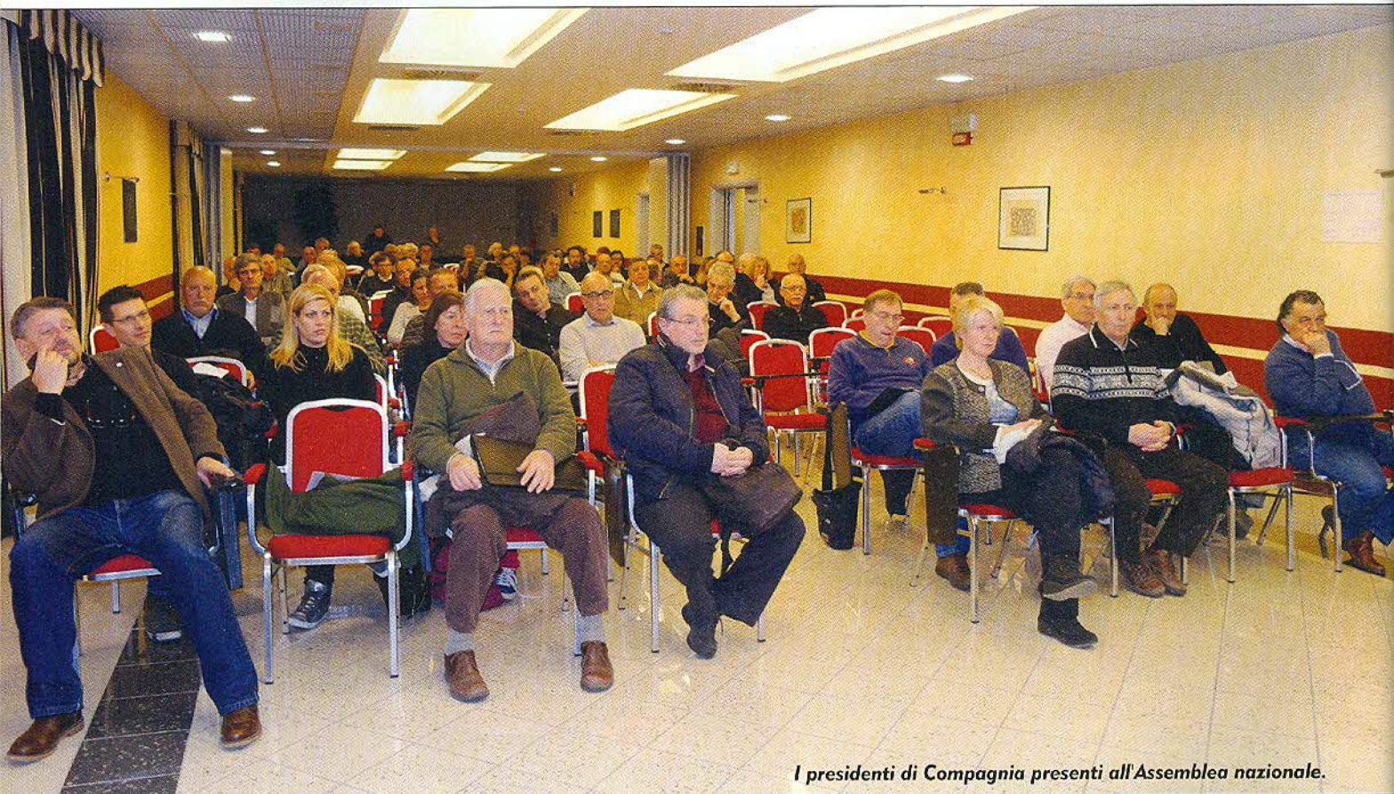
I presidenti di Compagnia presenti all'Assemblea nazionale.