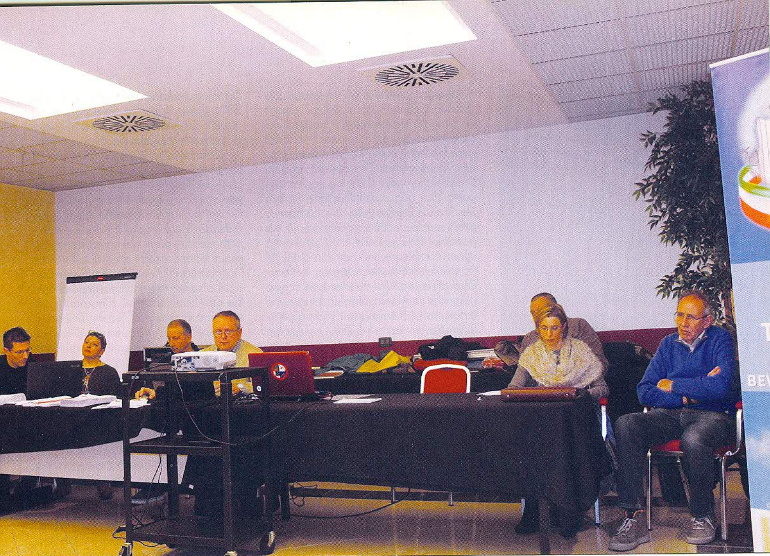
Il tavolo del Consiglio federale.

che deciderà di intraprendere, non ci resta che tracciare, attraverso la relazione presentata dal presidente Salvanti, un quadro di ciò che oggi è la Fiarc e dell'operato del Consiglio federale uscente. Partiamo con i numeri, che meglio di qualsiasi altra cosa possono fotografare la situazione: il 2014 si è chiuso con 7.108 tesserati, di cui 5.720 maschi (rispettivamente 4.884 cacciatori, 405 scout e 431 cuccioli) e 1.388 femmine (rispettivamente 1.095 cacciatrici, 132 scout e 161 cucciolle), distribuiti in 247 Compagnie, di cui 12 di nuova costituzione. Fra questi arcieri, 665 hanno la qualifica di istruttore (29 sono gli istruttori formati nel corso dell'anno), 947 quella di caposquadra (36 gli abilitati dell'anno scorso) e 349 quella di capocaccia (8 sono quelli che l'hanno ottenuta nel 2014). Passiamo ora alle cifre legate alle manifestazioni: nel corso dell'anno sono stati organizzati 155 gare di Campionato regionale, un Grand Prix disabili, due Campionati Italiani ed un Campionato Europeo. Sono complessivamente 3.416 i tesserati che hanno partecipato ad almeno una gara organizzata da