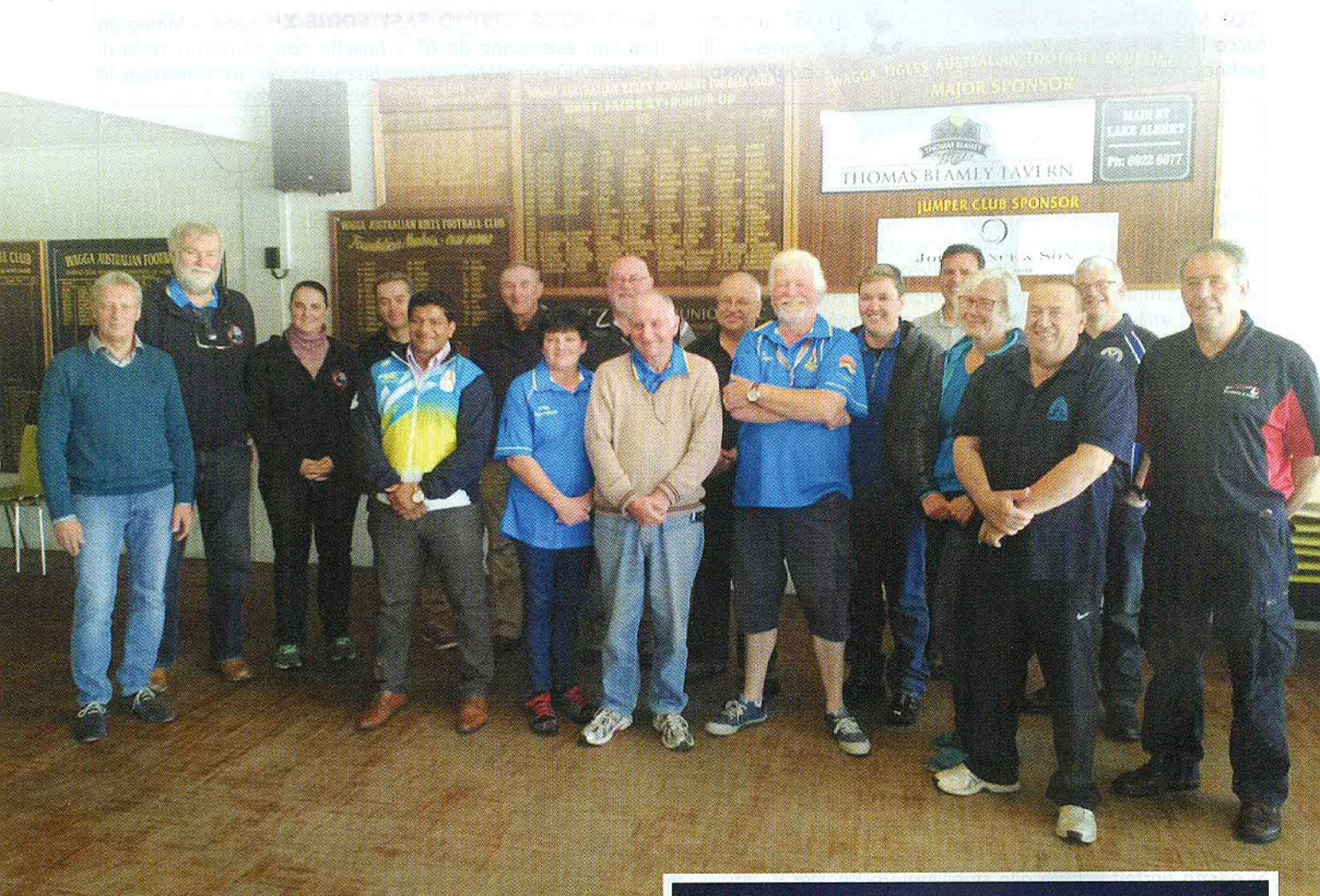
Foto di gruppo dei rappresentanti Ifaa a Wagga Wagga. Al Meeting mondiale la Fiarc è stata spesso citata come esempio per l'eccellente organizzazione della Federazione e dei suoi eventi, per la preparazione degli istruttori e per l'esistenza di capocaccia molto preparati.

Al Meeting mondiale in Australia, molte le novità importanti, tra cui la creazione di una nuova categoria di tiro e le modifiche al Regolamento del Torneo Champion of Nations, che si svolgerà anche durante il Wbhc 2017.