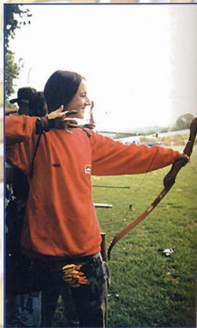
fossero praticamente vuoti, siamo stati intruppati tutti nelle prime piazzole, creando code e tempi di attesa ingiusti.

FEDERAZIONE ITALIANA ARCIERI TIRO DI CAMPAGNA Via Antonio Tantardini, 18 - 20136 Milano - Tel. 02/58.102.304 - Fax 02/58.113.438 e-mail: segreteria@fiarc.it - http://www.fiarc.it