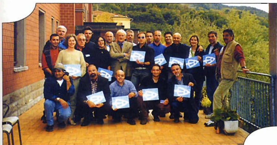
A sinistra: foto ricordo dei primi istruttori nazionali Fiarc diplomati. In basso: un momento degli esami.

Responsabile Commissione istruzione Fiarc