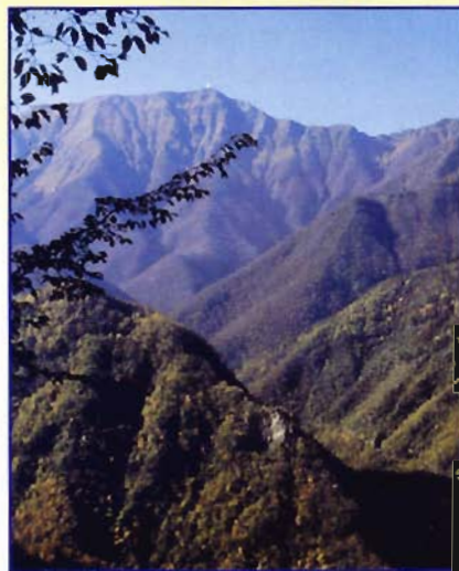
Il suggestivo paesaggio del Corno alle Scale dove si terranno i Campionati italiani della Fiarc a fine agosto.

Nel Parco e nelle immediate vicinanze si incontrano borghi caratteristici, in parte divenuti apprezzate mete turistiche estive e invernali, nei quali si conservano esempi di abitazioni, edifici religiosi e altri elementi tipici della montagna. Una raccolta di preziose testimonianze sulla cultura materiale degli abitanti di