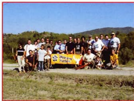
Gli arcieri di Yr.

"La scelta della località è stata determinata da diversi fattori, il primo è che già nel 1994 organizzammo i Campionati al Corno alle Scale e l'assistenza ricevuta e l'entusiasmo dimostrato dagli enti locali e dalla gente ci colpì molto e ci permise di organizzare un buon Campionato, funestato solamente dalle condizioni meteo. Inoltre il parco del Corno alle Scale è sicuramente la cornice ideale per svolgere un Campionato italiano di tiro di campagna; la natura è generosa sia nella fauna che nella flora, spiccano meravigliosi boschi di faggio, abetaie incantevoli contrapposte ad uno scenario che salendo di quota lascia il posto a verdi prati e ad una morfologia del territorio particolarmente suggestiva, oltre ad offrire una situazione logistica ed alberghiera di primo piano, che ci consente una razionalizzazione di cui beneficeranno gli arcieri. Anche quest'anno abbiamo trovato una grande disponibilità da parte del Comune di Lizzano, dell'Ente Parco, del Consorzio Albergatori, della Proloco, della Croce Rosso Italiana, del Soccorso alpino e non ultimo dell'Assessorato allo sport della