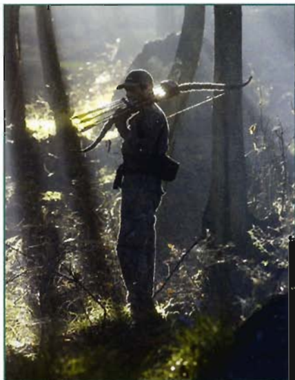
Autunno, le prime luci dell'alba regalano inquadrature da ricordare.

diventano meno prevedibili. Allenare il nostro istinto sopito è il miglior supporto all'esperienza acquisita sul campo. Dice ancora Rosini: "Bisogna imparare a vivere la natura senza arroganza, traendo spunto da un vocabolario fatto di odori, rumori e segni evidenti". Detta così può sembrare facile, ma non lo è, anche se i 15.000 anni di storia documentata dell'arco come strumento da caccia e da guerra sono alle nostre spalle per testimoniare. Sono una specie di codice genetico da riscoprire con coraggio e umiltà. Questi i presupposti su cui si fonda il successo senza precedenti dell'iniziativa assunta dai fondatori di Bowhunting Club, che mira a dare un contributo significativo alla divulgazione di una pratica antica e moderna, mix perfetto di istintività e ragione, esperienza e sete di sapere. Base di partenza per chi si voglia avvicinare a questa esperienza è, ovviamente, una